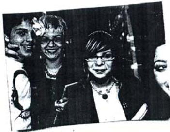
La scuola può aiutare i tuoi figli ad esprimersi

Ciò che conta è come presentano i loro compiti.